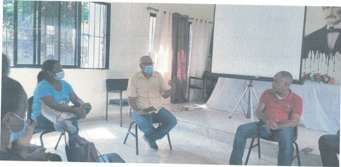
Rendición de cuenta Comunidad la Ermita Presupuesto Participativo