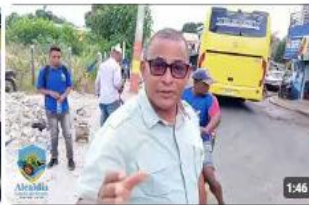
ESTUDIOS DE SUELOS PLANTAS DE TRATAMIENTOS 8 vistas · hace 1 año