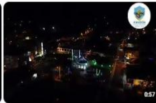
ENCENDIDO DE LAS LUCES DE NAVIDAD 2024 22 vistas · hace 1 año