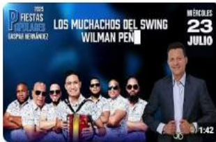
Fiestas Populares Gaspar Hernández 2025 449 vistas · hace 8 meses